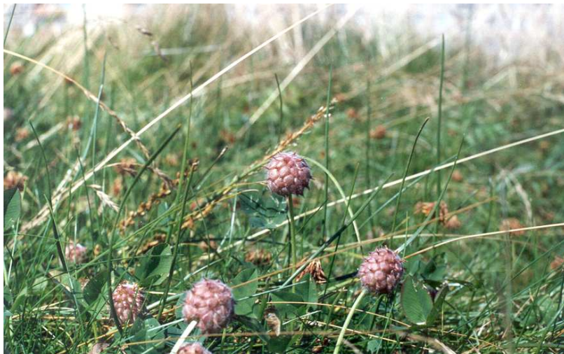
1.2.2. attēls. Zemeņu āboliņš piejūras pļavā.

Lielāko daļu aizņem periodiski pārplūstošas pļavas, no kurām plašākās atrodas Buļļupes un Lielupes krastos. Sausākās vietās sastopamas pļavas ar jūrmalas armēriju Armeria maritima , mitrākās vietās ar jumstiņu gladiolu Gladiolus imbricatus .