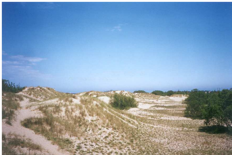
1.2.1. attēls. Kāpas Daugavgrīvē.

Kāpas ir viens no tipiskākajiem dabas parka "Piejūra" biotopu tipiem. Vislielākās platības aizņem priekškāpas un embrionālās kāpas, mazāk sastopamas pelēkās kāpas. Dabas parks "Piejūra" ir vienas no plašākajām priekškāpām Latvijā. Tas saistīts ar smilšu uzkrāšanos. Līdz ar to var teikt, ka parka teritorijā priekškāpas ir šā kāpu tipa etaloni Latvijā. Pelēkās kāpas sastopamas šaurās joslās starp priekškāpām un mežu vai krūmājiem. Par kāpu attīstību un izplatību izklāstīts 1.3.2. nodaļā.